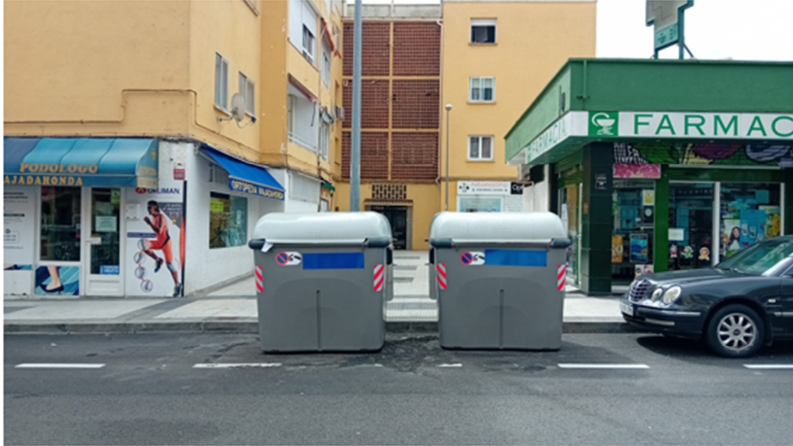
Imagen 4. Nuevos contenedores instalados.