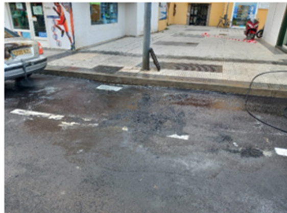
Imágenes 2 y 3. Contenedores quemados y su posterior limpieza.